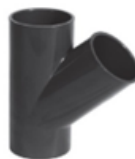
UPVC Solvent Single Branch T 45