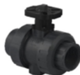
شیر توپی باقابلیت نصب عملگر