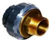
مهیره ماسوره یکسر مغزی برنجی