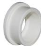
فلنج پلی پروپیلن