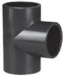
UPVC One Side Female Threaded TEE