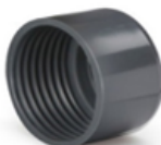
تبدیل یکسر دنده