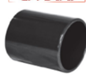
UPVC Double Socket