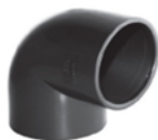
UPVC One Side Female Threaded 90 Elbow