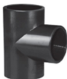
UPVC One Side Female Threaded TEE