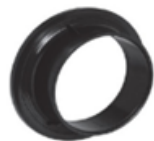
فلنج آب بند