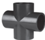
UPVC Solvent Cement 90 Cross