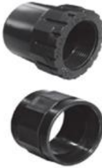
UPVC One Side Female Threaded Reducer Adaptor