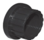
فلنج آداپتور دنده ای