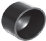
UPVC Solvent Cement End Cap