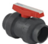
شیر توپی ضد اسید چسبی