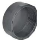
کپ داخل دنده