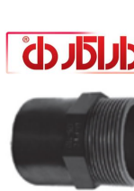
UPVC One Side Male Threaded Reducer Adaptor