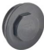
درپوش رزوه ای