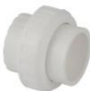
مهره ماسوره پلی پروپیلن