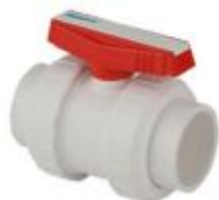
شیر توپی پلی پروپیلن