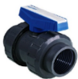
شیر توپی دنده