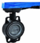
شیر پروانه ای