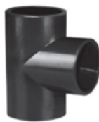
UPVC Female Threaded TEE